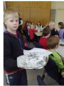
Midgård och Utgård fick också smaka