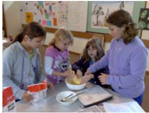
Yggdrasil bakar chokladbollar